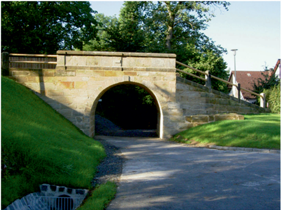
Das Geseeser Kirchwegbrückla