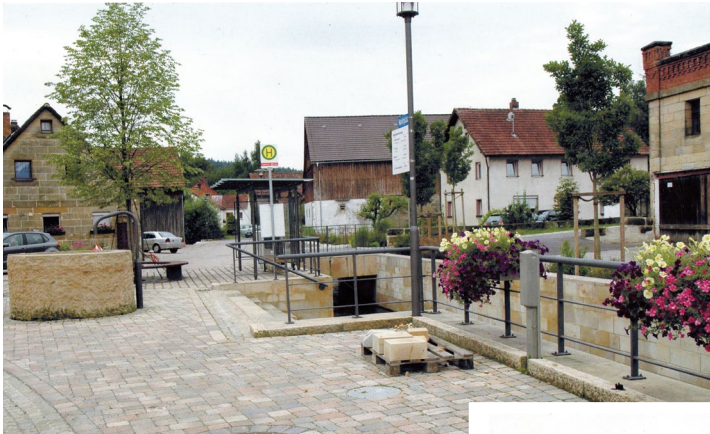
Marktplatz in Obersees

Nochmals sei betont, dass ich damit keinesfalls eine teilweise Umdeutung des Oberseeser Wappens vornehmen will, denn vieles dieser Deutung ist ja ähnlich oder gleich.